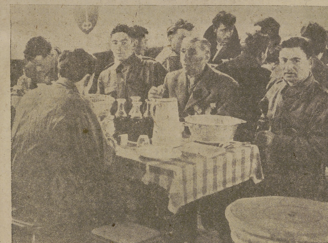
Es bien sabida la dramática lucha que el natural de Argelia importante colonia francesa en Africa, sostiene con el galo, quien a todo trance quiere conservarla porque sin ella su comercio metropolitano sufre grave quebranto. Más de 200 000 muchachos franceses están allí peleando a ese fin. En una rústica mesa, en pleno campo de batalla, los veteranos soldados del 1914 y los recién movilizados, se han juntado en fraternal camaradería, se reparten las mismas viandas, mientras se oyen los relatos de hazañas heroicas que el valor francés rubricó con su sangre.