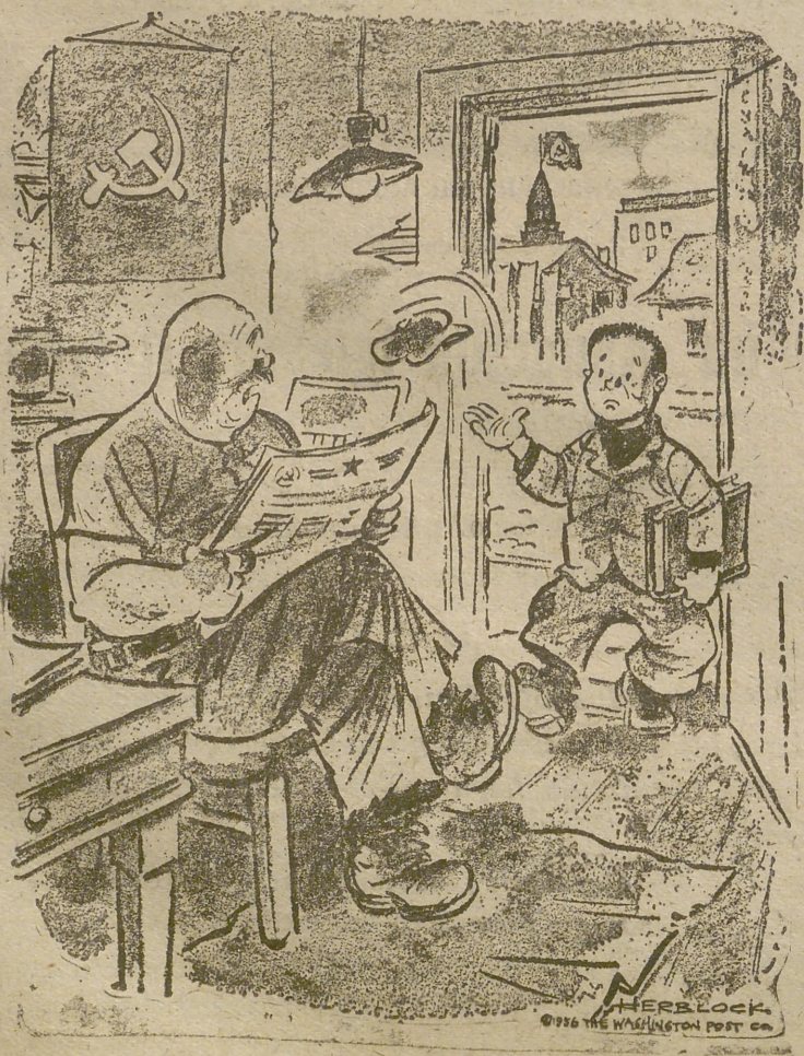
¡Hola, camarita! ¿Qué has desaprendido hoy?

Guerras, Plaza José Tpmé. Aparicio, Avda. José Antonio