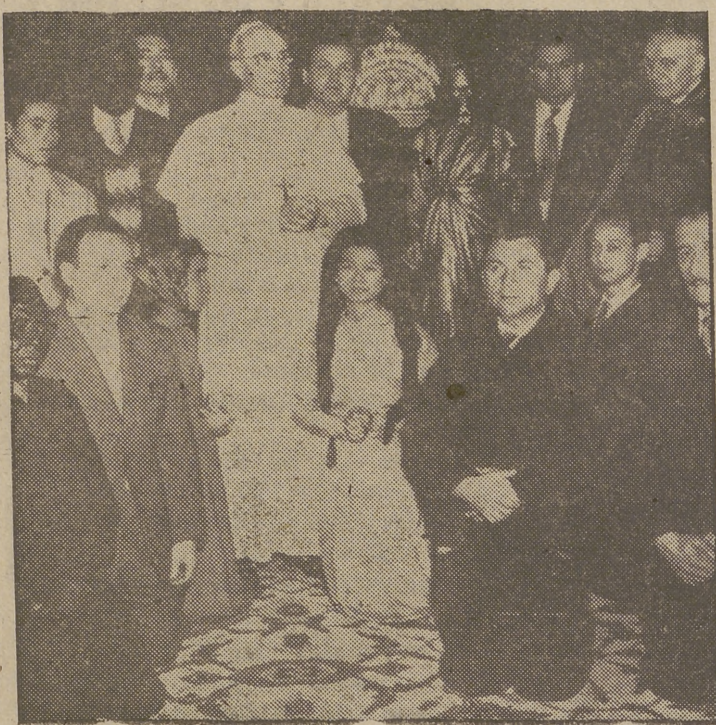
Su Santidad Pío XII concedió una recepción a obreros de diversos países, representantes de la fe de todo el mundo. Durante ella, fué entregada al Santo Padre una estatua de Cristo, trabajador de Nazareth, momento que reproduce la foto de Cifra Gráfica.

El derecho de legación, activa y pasiva, que sigue a tal soberanía ha sido ejercido siempre por la Iglesia en el curso de los siglos. Legados «ad laterem», legado nato, etc., fueron verdaderos representantes del Papa en el derecho antiguo; en el actual, se llaman nuncios, internuncios o delegados apostólicos. La legación pontificia tiene un doble aspecto; la relación que el Papa tiene con la jerarquía y los fieles y la relación con los Gobiernos civiles. Ambos aspectos derivan de la intrínseca naturaleza de la soberanía espiritual de la Santa Sede; no el reconocimiento de los Estados civiles, ni la condición de jefes temporales de los Estados Pontificios, que corresponde al Papa. De aquí que los Estados civiles