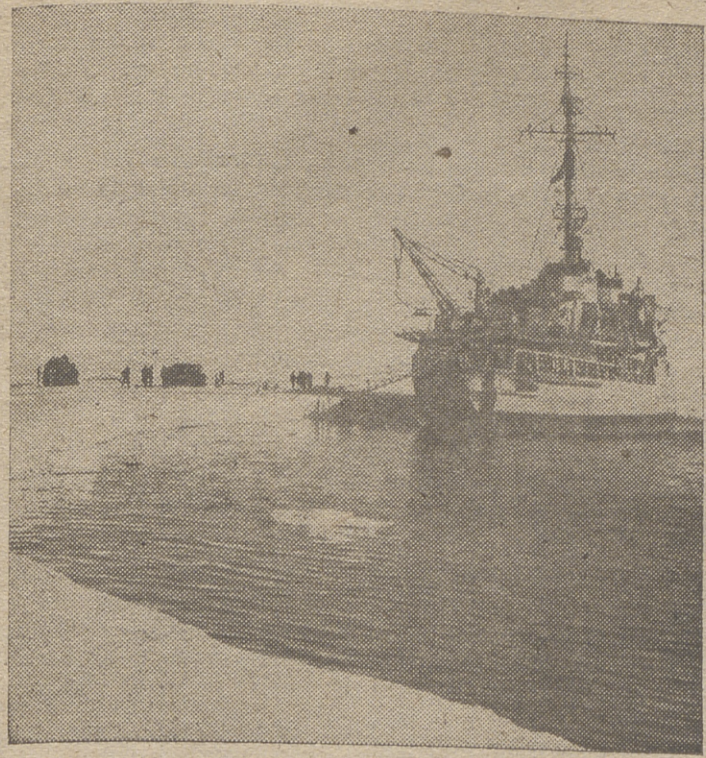
De 1957 a 1958, hombres de ciencia de treinta y nueve naciones colaborarán en el estudio más completo que se haya hecho hasta ahora del globo terrestre y de la atmósfera que lo rodea. Ese programa de investigaciones ha recibido el nombre de «Año Geofísico Internacional 1957-58». Como parte de la preparación del programa, los Estados Unidos han enviado a principios de este año al rompehielos «Atka» al Antártico para establecer campamentos. Es de esperar que durante el Año Geofísico Internacional se obtengan muchos datos tan nuevos como importantes