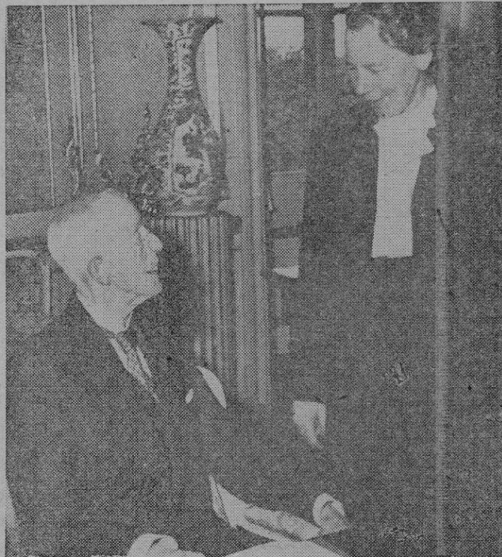
El Rey Gustavo, el anciano monarca de Suecia, conversa en su palacio de Estocolmo con una mujer que es actualmente ministro de su gobierno. Es la primera «femina» que asume funciones ministeriales a lo largo de la historia de la nación sueca.