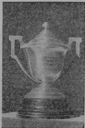
La magnífica y gran copa, «Jinetes de Alcalá» que será disputada en las carreras de mañana