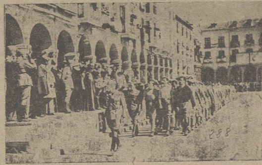
Nuestras calles recoletas y silenciosas, sentirán estremecerse ante el recio y firme pisar.

Desfile de Centurias azules, y de escolares llenos de fe, portando al aire las primeras sus guiones cargados