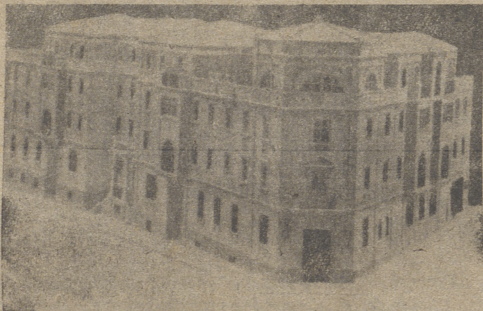
EDIFICIO DE SU PROPIEDAD

«Pronto habrá después de un Primero de Mayo terrible, un dos de Mayo más glorioso que el de 1808».