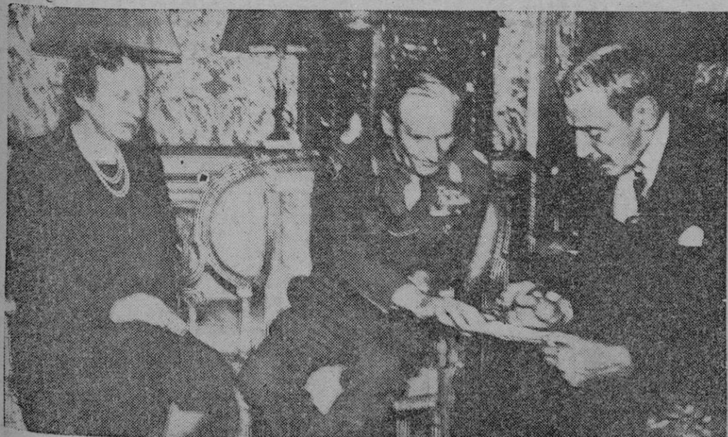
En la fotografía superior el Rey Cristián de Dinamarca que falleció el pasado día 20 en Copenhague. En la inferior vemos al monarca danés conversando con Montgomery después de la liberación del país por las fuerzas aliadas. (Fotos Archivo).

LONDRES, 21. (Efe). — SEGUN COMUNICAN DE MOSCU A MEDIA TARDE, LA JUNTA DE MINISTROS DE RELACIONES EXTERIORES ACORDO TRANSFORMAR SU REUNION DE HOY EN SECRETA, DESPUES DE UNA HORA CUARENTA MINUTOS DE SESION ORDINARIA, EN LA QUE NO PUDIERON LOGRAR ACUERDO EN LOS PUNTOS DE IMPORTANCIA DEL TRATADO CON AUSTRIA.