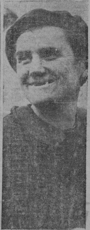
«Madame Louise» cifra su mayor orgullo en el hecho de ser la única mujer minera de Francia. La ley francesa que prohíbe que las mujeres trabajen en galerías subterráneas, no ha podido impedir que «madame Louise» prestase sus servicios en las minas de carbón de Decazville, las únicas de Europa que están al aire libre.