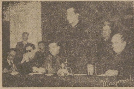
11 de enero de 1936

Ya hace días que el ambiente de nuestra ciudad anunciaba la celebración de estos importantes actos conmemorativos del día en que en el antiguo Teatro Liceo, hoy Gran Cinema, habló el fundador de la Falange, José Antonio Primo de Rivera, y cuya fecha, según concesión de la Secretaría General del Movimiento,