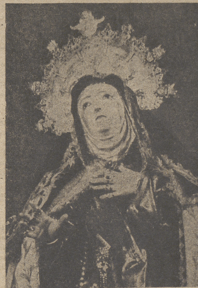
Santa Teresa de Jesús, según la veneramos en la casa donde nació hace 437 años. (Fotos Mayoral).

a) Respecto a la costumbre de invernar en las aldeas, sería un argumento de mucha fuerza si se tratase de una costumbre necesaria, que no admiri-