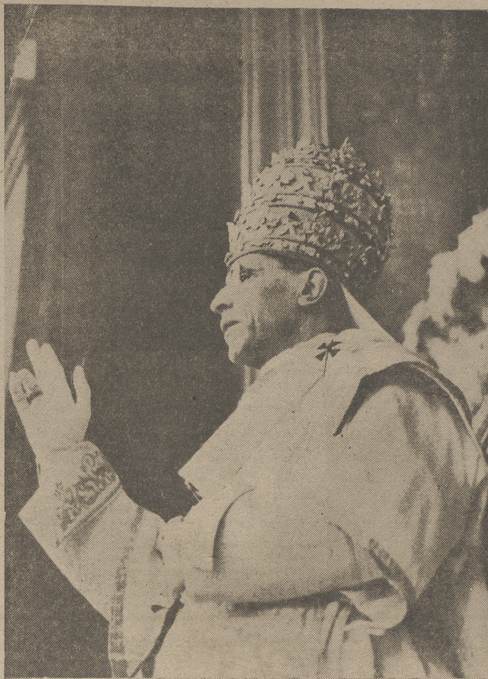
En el día del Papa, unidos a los sentimientos de nuestro Venerable Prelado Diocesano con todos los fieles de la Diócesis, elevamos nuestras preces al Cielo pidiendo que Dios guarde y vivifique a nuestro Santísimo Padre, Pío XII, a quien rendimos el humilde homenaje de nuestro amor filial y devoción católica, sintiéndonos henchidos de gozo por saber que su bendición nos alcanza junto con los paternales afectos de su corazón amantísimo para todos los fieles del mundo.