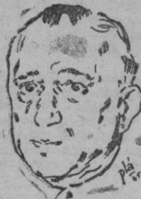
JAMES F. BYRNES

hasta ahora el cargo de Embajador norteamericano en China y es esperado en Washington dentro de unos días. EFE