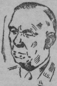
EL GENERAL MARSHALL

Washington, 7. — La Casa Blanca ha anunciado que el Secretario de Estado norteamericano, James F. Byrnes, ha dimitido. El Presidente Truman anunció