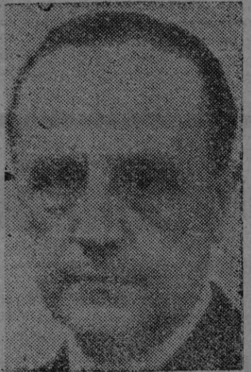
El Ministro de Justicia, quien defendió el proyecto de ley de Arrendamientos Urbanos

En este día de tantos recuerdos para todos los mallorquines y para todos los mallorquines, es de justicia elevar una plegaria por nuestro Rey Conquistador y por tantos mallorquines que cooperaron a la gran empresa de la liberación de Mallorca.