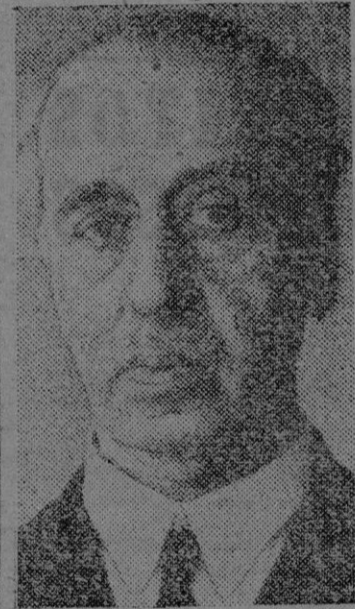
El Ministro de Hacienda, el cual defendió el dictamen del proyecto de ley de Ordenación Bancaria

Expuso después su reconocimiento a los componentes de la ponencia y de la comisión, especialmente a don