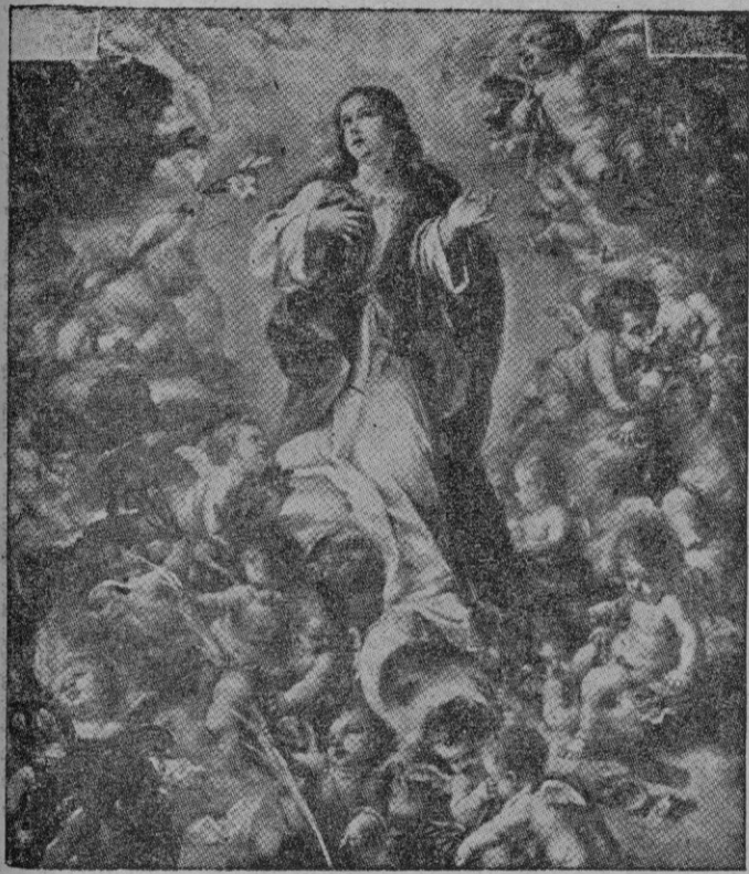
La Inmaculada Concepción (Cuadro de Valdés Leal, existente en el Museo de Pinturas de Sevilla)

Si en el Concilio de Basilea triunfan la fe, la sabiduría y la fuerza dialéctica de Juan de Segovia, en el de Trento no se apunta menor gloria el Cardenal Pedro Pacheco, obispo de