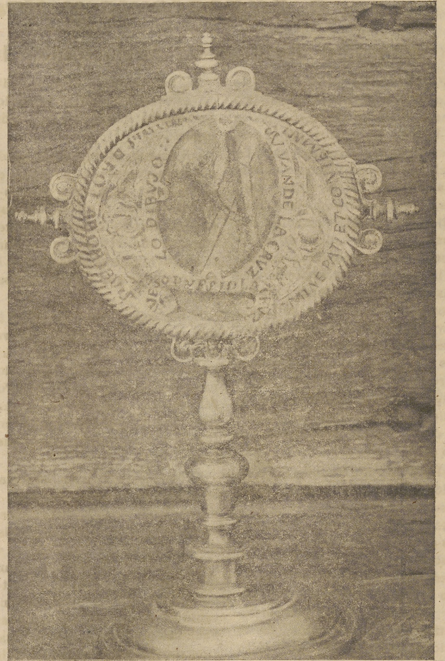
Jesús Crucificado como fué visto y dibujado por San Juan de la Cruz.

En nuestros días se llegó, dentro de la casa, a tal estado de penuria, que las religiosas cuando llovía hubieron de utilizar paraguas bajo el techado. A esto, ante Dios sea el mérito, puso remedio con ca-