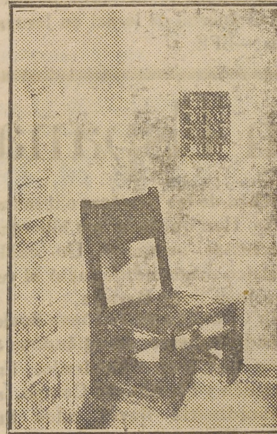
Confesonario en la capilla de la Transverberación.

Nos cuentan las crónicas que en tiempos de Santa Teresa de Jesús los techados de la fábrica de este convento de Nuestra Señora de la Encarnación eran de teja vana, de manera que los brevarios de las religiosas se cubrían de nieve durante el invierno, y en verano podían leer en ellos con las ventanas cerradas. En los siglos XVII y XVIII se construyeron las principales edificaciones del ac-