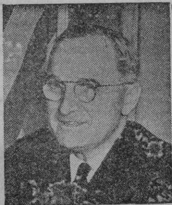
EL PRESIDENTE TRUMAN

Londres, 3. — El periódico "Sunday News" pronostica una gran victoria de los republica-