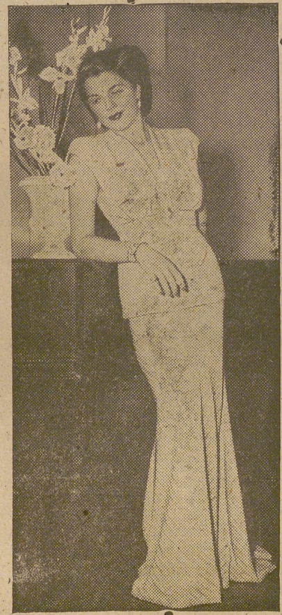
Traje de noche presentado en un reciente desfile de modas, de color azul y plata; cuerpo separado de la falda, ésta con cola.

Póo. El ministro de Industria y Comercio, señor Suanzes, pronunció a continuación un documentado discurso, poniendo de relieve el interés del Caudillo por todos los problemas de la colonia de Guinea y la importancia que concede no sólo a lo económico y social, sino también, y muy principalmente, a cuanto se refiere al espíritu.