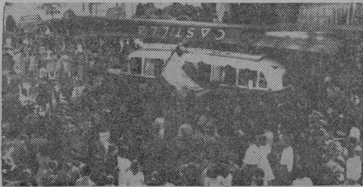
Llegada de los remeros de Pedreña con su trainera "Castilla" a la capital montañesa, después de su triunfo en las regatas de San Sebastián