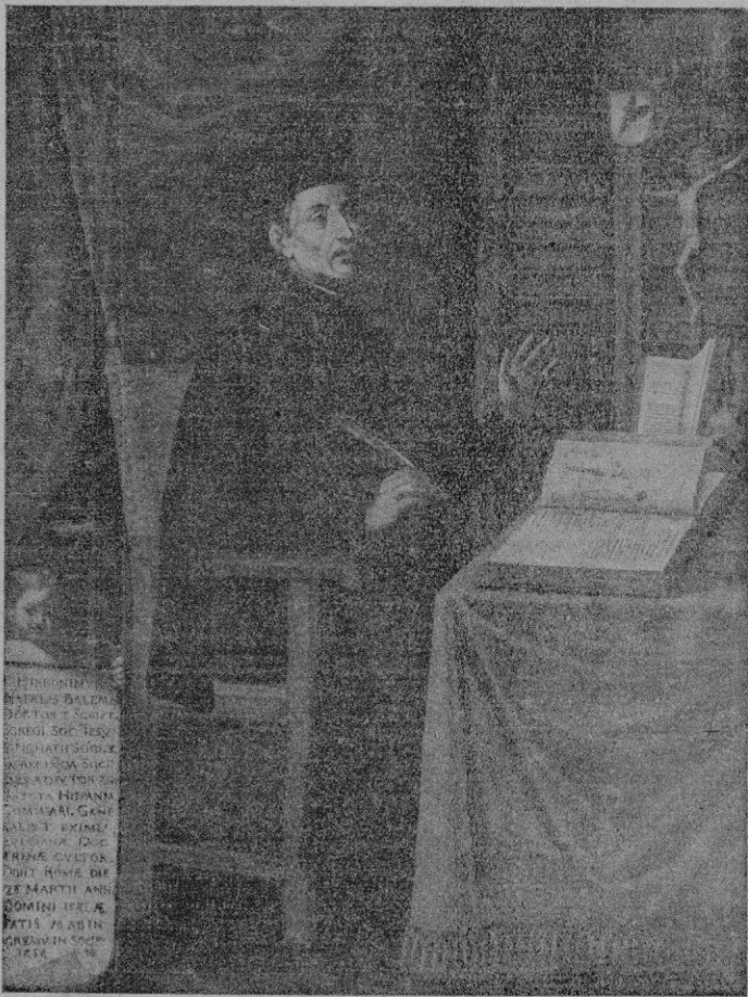
El P. Jerónimo Nadal