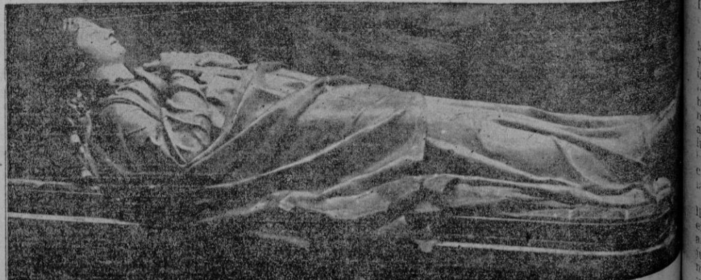
La imagen de la Virgen tallada por Adrián Ferrán