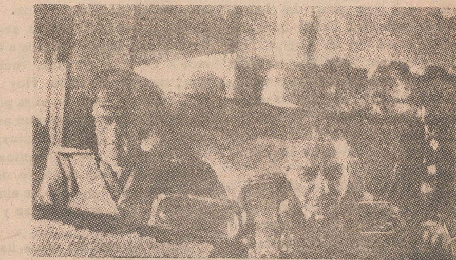
El Caudillo ha inaugurado la nueva línea férrea electrificada Madrid-Segovia. Vemos aquí al Generalísimo acompañado del ministro de Obras Públicas, señor Fernández Ladreda, en el vagón de cabeza en el que celebró el recorrido de la nueva línea.

El Consejo de Seguridad dió fin a la sesión después de dos horas y media de discusiones sin haber alcanzado decisión alguna y quedó señalada la próxima reunión para mañana por la mañana. Esta sesión de hoy ha sido la quinta que se celebra dedicada al problema de Indonesia.—EFE.