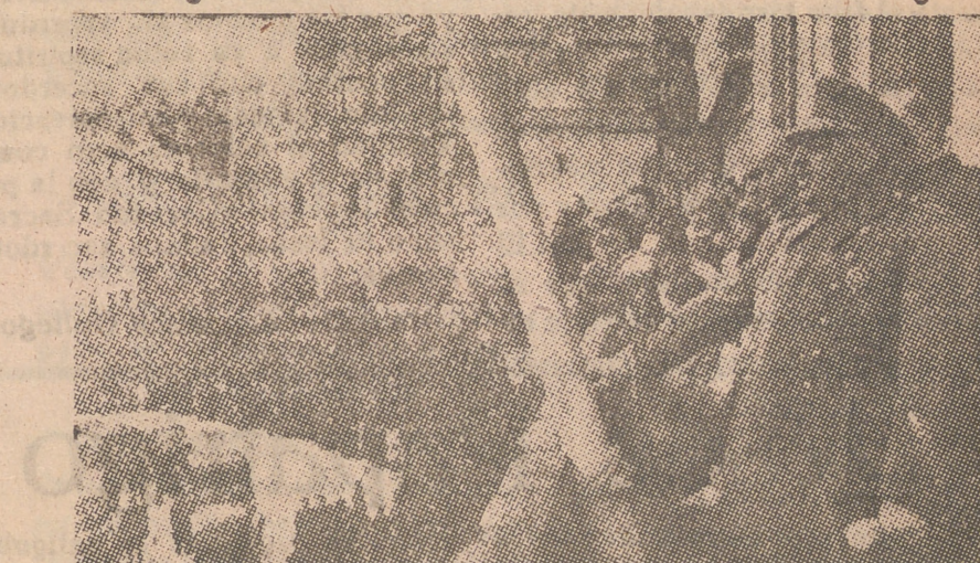
A la llegada a Segovia y tras el solemne Te Deum en la Catedral, el Caudillo, ante millares de segovianos agrupados en la Plaza Mayor de la vieja ciudad castellana, pronuncia su interesante discurso.