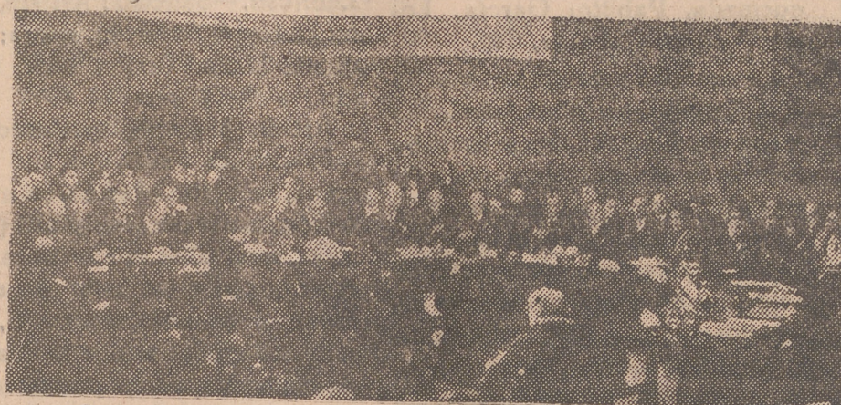
He aquí una reunión de los miembros integrantes del Consejo de Seguridad de la O. N. U. con los secretarios, adjuntos taquígrafos y periodistas. En el seno del Consejo es donde se planteó la famosa controversia anglo-rusa entre Bevin y Vichinsky.

LONDRES, 11.—El delegado norteamericano en la O. N. U., Stettinius, se opuso radicalmente a la creación de una Comisión especial que investigue la situación de Indonesia, en la sesión del Consejo de Seguridad. Criticó indirectamente a Ucrania por poner en duda la buena fe de la Gran Bretaña. Stettinius también se opuso a cualquier otra acción por parte del Consejo de Seguridad respecto a la acusación hecha por Ucrania contra la Gran Bretaña. Dijo que, no obstante, el Consejo podría expresar sus buenos deseos para que se lleve a cabo lo antes posible la rendición de todos los japoneses en Indonesia. Llamó la atención sobre el hecho de que en estos momentos se están celebrando negociaciones entre el Gobierno holandés y los indonesios y advirtió que «sería una falta muy seria tomar una acción que pudiera perjudicar el resultado de estas negociaciones».