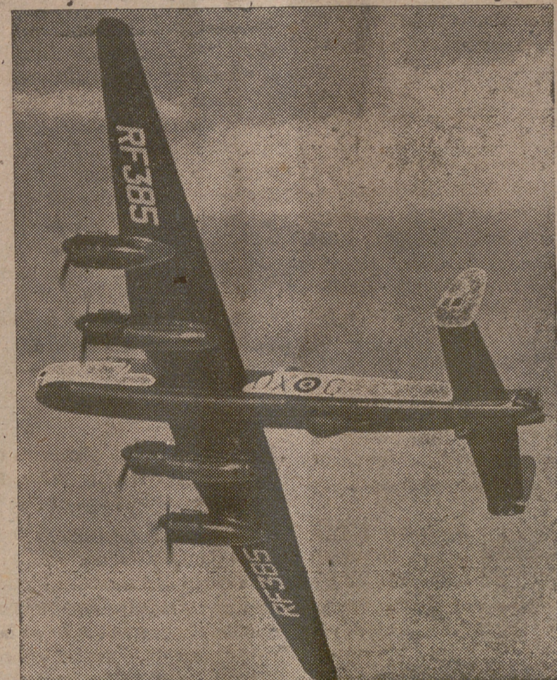
He aquí la primera fotografía hecha pública del mayor y mejor aparato de bombardero que posee la RAF, en la actualidad: el «LINCOLN». Va equipado con «RADAR», y lleva diez ametralladoras distribuidas en las dos torretas del avión.

Al extender los modelos de afiliación al Régimen Nacional de Subsidios Familiares, no olvidéis consignar claramente vuestro nombre y dos apellidos e igualmente los de vuestra esposa. Así evitaréis la falta de percepción del Subsidio ante la posible identidad de dos titulares.