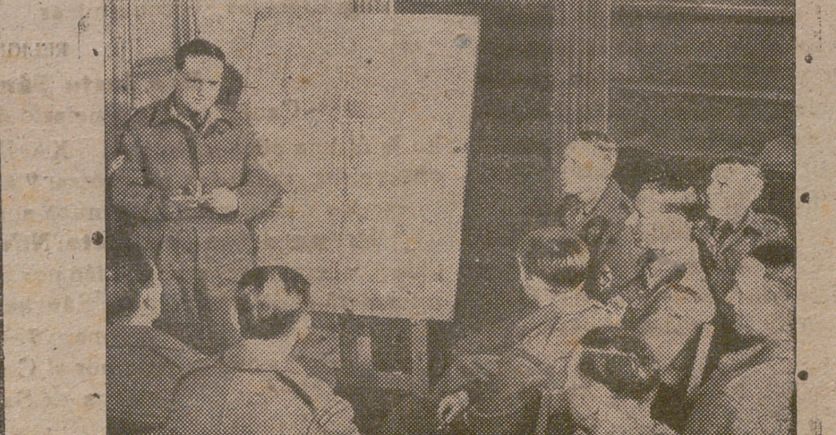
Todos los ex prisioneros británicos de los campos de concentración en Alemania, son informados detenidamente, a su llegada a Inglaterra, de todos los cambios efectuados en la vida social inglesa a fin de tenerlos al día en todos los aspectos