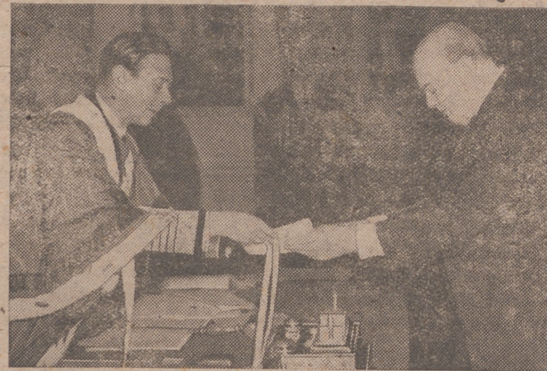
En una ceremonia tradicional el Rey Jorge VI nombra Miembro Honorario a Mr. Winston Churchill. Esta ceremonia tuvo lugar en la Mansión House, en Londres