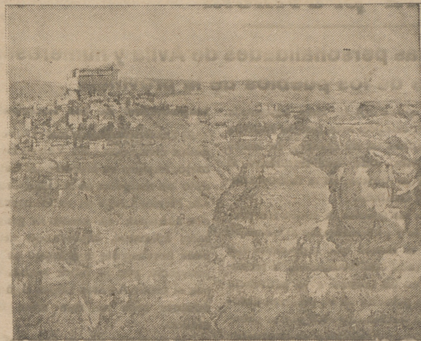
Cuadro que fué premiado en la última Exposición Nacional de Bellas Artes con la medalla del Ministro del Ejército, obra del pintor toledano Enrique Vera y que ha sabido interpretar en este lienzo el magnífico paisaje agreste y duro de Toledo donde se ve coronado todo el antiguo Alcázar toledano.

Trabajan ahora los primeros obreros; pocas brigadas porque los trabajos iniciales no necesitan más. Después acaso sean miles los que laboren en este magnífico proyecto de los ingenieros Carrasco, Hernández y Ureña. El total de pabellones serán veintisiete, manteniendo la misma unidad ar-