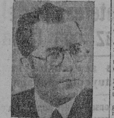
El Vicepresidente de la Federación Española de Ajedrez