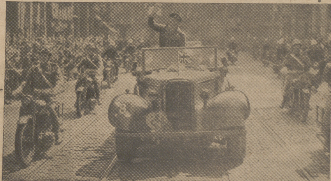
El Mariscal Montgomery saludando a la población de Amberes durante la visita que hizo a esa ciudad belga, que le otorgó el nombramiento de hijo adoptivo

Estos modos no se han equivocado nunca y lo curioso del caso es que ningún americano o europeo han podido enseñar a un mono el arte de conocer las monedas.