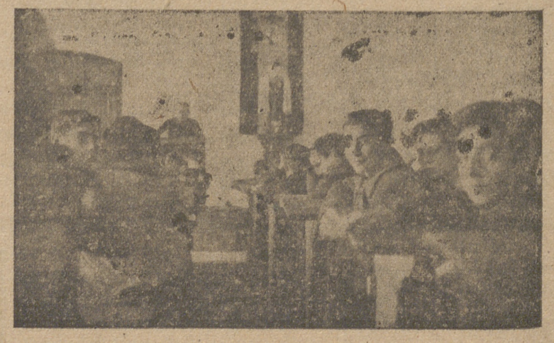
Su selecto cuadro de profesores, dirigido por un sacerdote, es garantía de la enseñanza que reciben.

PORQUE: Contando con amplios patios y campos de deportes, es segura la fuerte constitución del colegial. PORQUE: Poseyendo Laboratorios propios, las enseñanzas son eminentemente prácticas. PORQUE: Todas las actividades del alumno se hallan constantemente vigiladas por sacerdotes que rectifican sus defectos para conseguir un perfecto intelectual cristiano, y PORQUE: En la primera estadística quinquenal del Ministerio de Educación Nacional le ha correspondido el 73'70 por 100 de alumnos aprobados en el Examen de Estado.