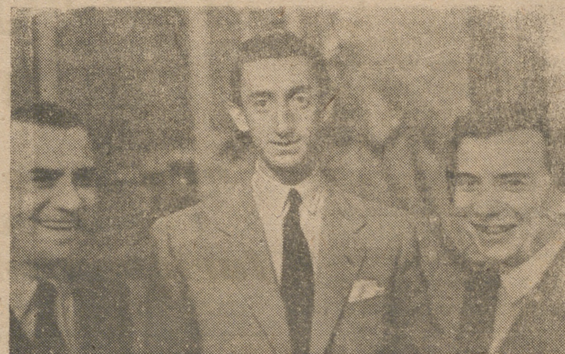
Manolete «sonríe» dentro de su serenidad, en la prueba de fotogenia a la que le someten sus amigos Kaps y Joham, de la Revista Vienesas.

El ejemplar comportamiento de este conjunto de islas, aisladas e invulnerables bastiones, dificultad extraordinariamente la actividad enemiga contra las islas Marianas y Carolinas, cumpliendo de este modo la difícil misión que les ha cabido en la gigantesca contienda que se desarrolla en el mundo.