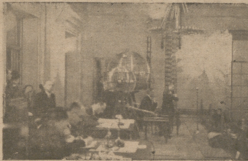
En el interior de la sala donde se efectúa el sorteo de Navidad los niños del Asilo de San Rafael se disponen a cantar el número ante el público madrileño.—(S. O. C.)

Los tres millones del tercer premio los llevó un jefe de Telégrafos para un Asilo de Huérfanos en Murcia