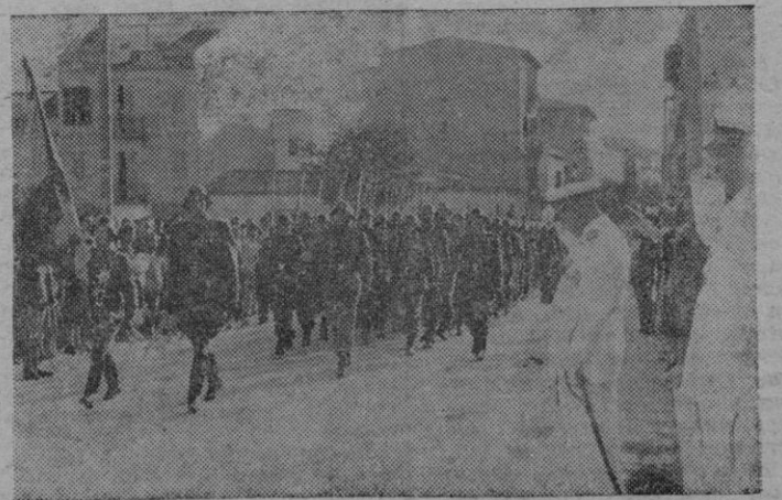
El Excmo. Sr. Ministro de Industria y Comercio saludando a la bandera cuando las fuerzas de Infantería desfilan en columna de honor