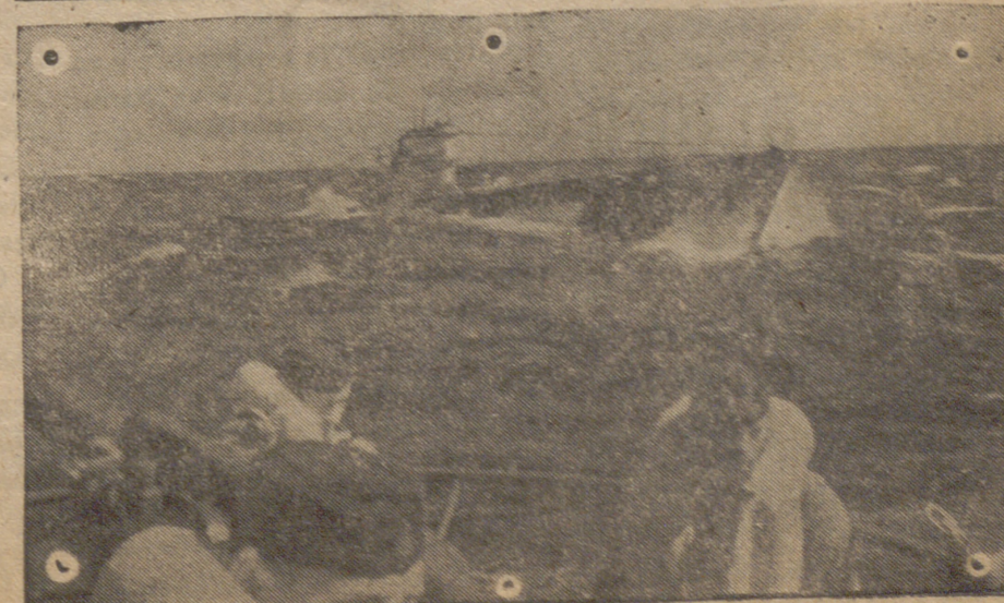
Dos sumergibles alemanes, en servicio en el mar del Norte hacen frente a los efectos de la fuerte galerna.

Finalmente el ministro inauguró los dos magnos Institutos. (Cifra)