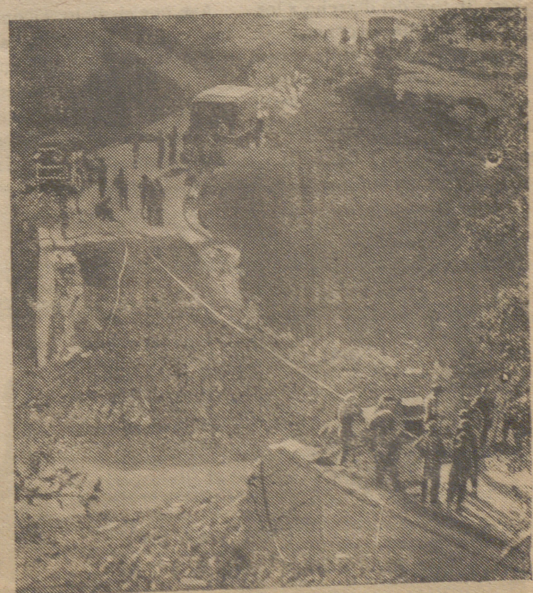
Zapadores ingleses se disponen a reparar un puente volado por los alemanes en el frente francés.

los planes de la paz cuentan también, y con calidad excepcional, los pueblos que no fueron arrastrados a la lucha, y que guardan su función de reserva moral y de armonía internacional». En este sentido, desde el principio de la guerra hasta el momento actual han sido explícitas las declaraciones de España, tanto por su voz oficial como por sus representantes culturales. La experiencia de la anterior postguerra debe ser aprovechada a fin de instalar a los pueblos europeos en un marco de convivencia más firme y con un orden social más consistente. «La descomposición de la sociedad europea a consecuencia de la demoralización producida por la Gran Guerra mundial, ha llevado a los pueblos a una doble violencia: hacia dentro, a la lucha encanada de las clases, y hacia fuera, a la lucha resentida de las naciones». No sólo se trata, pues, de un frente guerrero, sino también de un frente social y espiritual; y esta segunda guerra mundial produciría consecuencias gigantescamente desastrosas si no se piensa rectamente en una ordenación justa del mundo próximo, sin corrientes de disolución y de anarquía. ¡Arriba España! (El Español, 4 de septiembre de 1943).