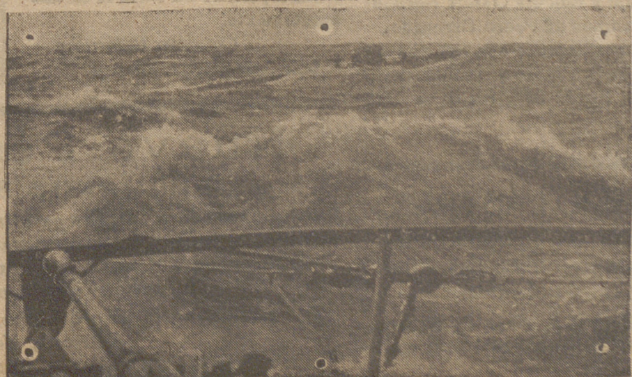
Los submarinos alemanes se encuentran en pleno Atlántico. De uno a otro se lanzan los saludos de rigor.

(Así, de esta manera tan «particular», cuyo comentario dejamos al lector, arreglan los anglosajones todos los asuntos de sus aliados siempre que hay un interés ruso de por medio).