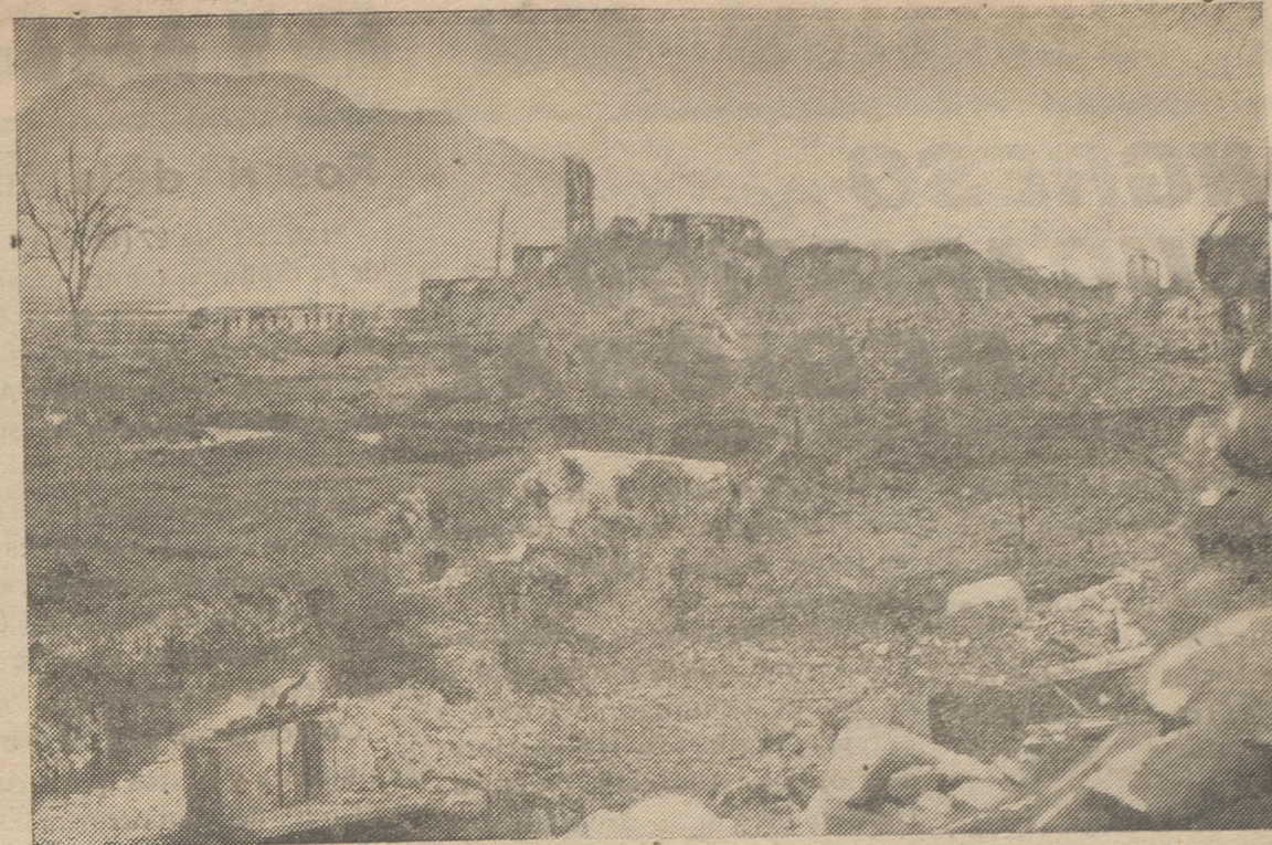
Una vista de Cassino, después de ser ocupada por las tropas del VIII Ejército británico.

En el frente de Moldavia fueron derribados cuatro aviones enemigos».—EFE.