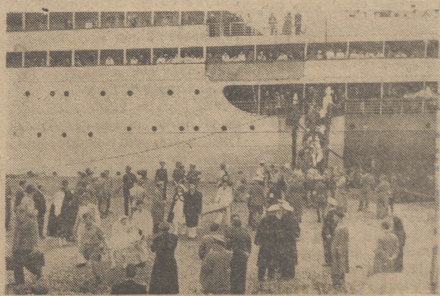
Actividad y movimiento con una perfecta organización preside las operaciones del canje de prisioneros de las potencias en lucha, en el puerto de Barcelona.

LONDRES.—«Los aliados han roto hoy la pausa de una semana, en la sucesión de sus ataques aéreos contra Alemania —escribe la Agencia Reuter, refiriéndose a la guerra aérea—. Las informaciones