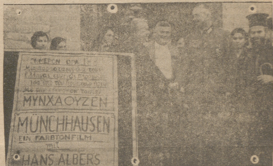
En un cine de la isla de Kreta se representa la película alemana «Baron Munchhausen». El alcalde de la ciudad da las gracias al comandante militar alemán por esta sesión de cine.