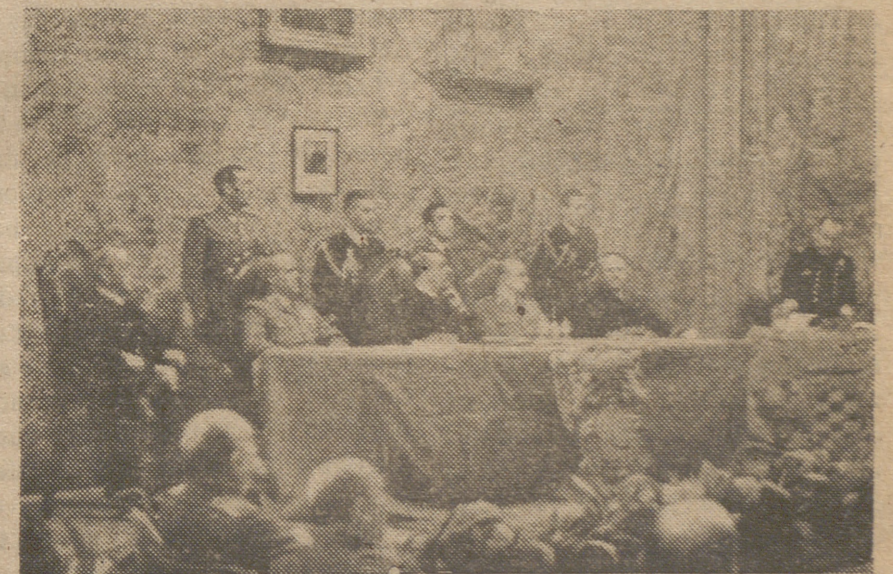
Inauguración del curso en la Escuela de Guerra Naval, acto que presidieron los ministros de Marina, Ejército y Aire.