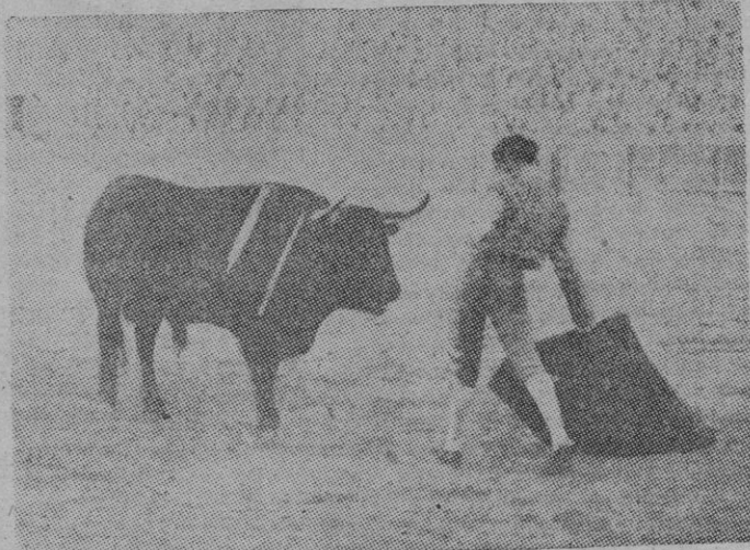
Juan Belmonte ante un toro de Miura dominado por el poder de su mágica muleta

Para que se hagan buen cargo del celo que en aquel entonces ponían los ganaderos para mantener su prestigio de sus hierros y divisas, citaremos un