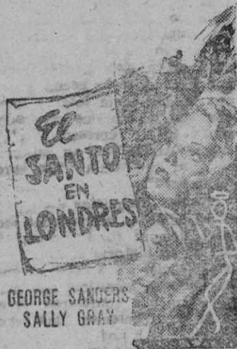
GEORGE SANDERS SALLY GRAY

El héroe de los más emocionantes episodios policíacos trabaja a favor del servicio secreto inglés y rompe las mallas de una complicada red de espionaje