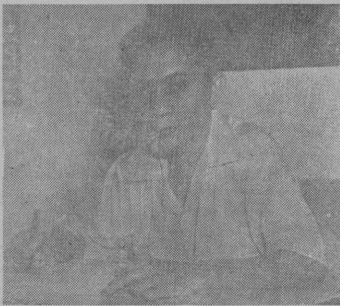
Sutan A. Suahrir, Primer Ministro del Gobierno indonesio que ha constituido el Presidente Soekarno, en lucha contra los holandeses