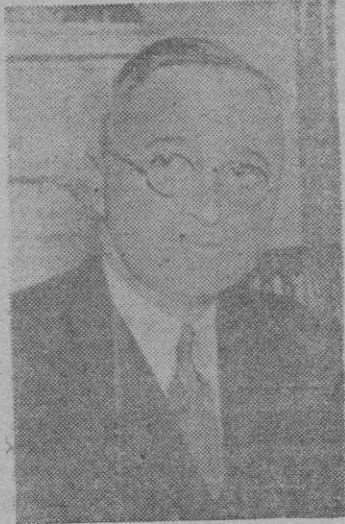
EL PRESIDENTE TRUMAN

Washington. — El Presidente Truman ha declarado que no tiene conocimiento de que la U.R.S.S. haya expresado su des-