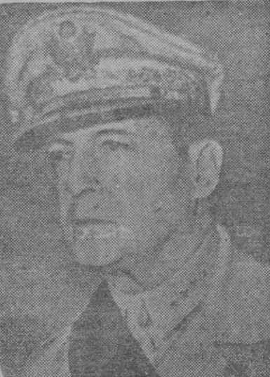
EL GENERAL MAC ARTHUR

Al referirse al supuesto des acuerdo entre los delegados de la Conferencia de Londres, dijo que se trataba solamente de conjeturas.