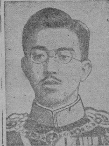
EL EMPERADOR HIRO-HITO

Tokio. — El Emperador Hiro-Hito visitará hoy, jueves, por la mañana, al jefe supremo de las fuerzas aliadas de ocupación