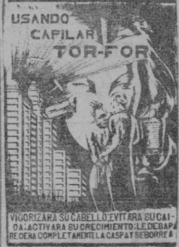
VIGORIZARA SU CABELLO EVITARA SU CALVA. ACTIVARA SU CRECIMIENTO. LE DESAPARECERA COMPLETAMENTE LA CASPA Y SEBORRREA.

Nueva York. — El expreso de Pensilvania ha descarrilado cerca de Búfalo produciéndose 15 muertos y 12 heridos.