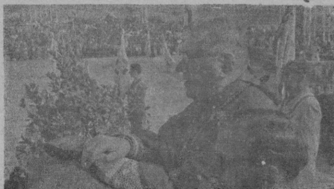
Un aspecto de la solemne clausura del Año Jubilar celebrada en el Cerro de los Angeles y a la que asistieron más de ocho mil almas.