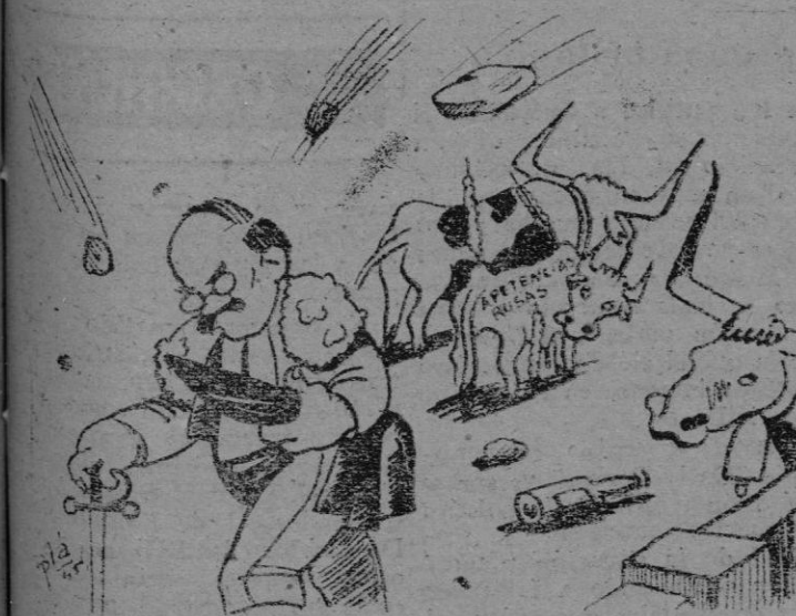
De los periódicos — Chiquito del Cáucaso, codicioso y mal en todos sus toros. Gran bronca.