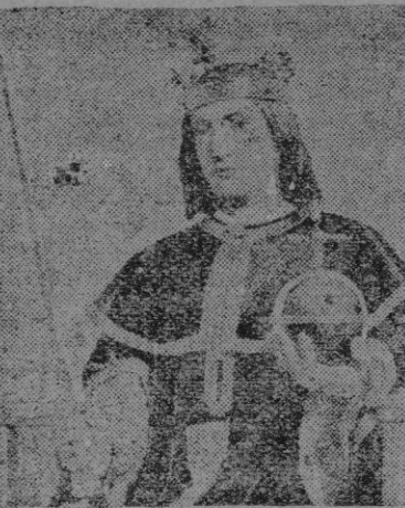
Rey de Castilla y León, Patrón del Cuerpo de Ingenieros Militares y del Frente de Juventudes