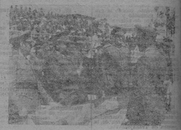
El Excmo. Sr. Capitán General al entrega personalmente los premios de los Campeonatos.