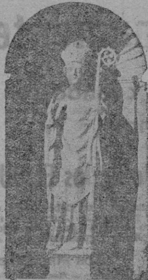
San Nicolás de Bari