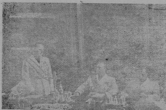
El Excmo. Sr. don Raimundo Fernández Cuesta, durante el discurso que pronunció en el sole mne acto de su toma de posesión de la Presidencia del Consejo de Estado.