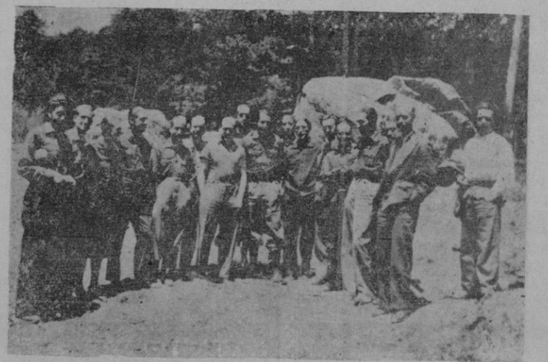
José Antonio, con otros jefes de la Falange, en una reunión celebrada en la Serra de Gredos

Por lo mismo que casi todos contrubuyeron a su venida, la totalidad de los más hubo de sentirse estafado al comprobar como un paso dado con tanta trivialidad les ponía en riesgo las cosas que a los españoles de a cómodo y despreciada Monarquía les fueron tan gratas; orden, paz interior, respecto a personas y haciendas.