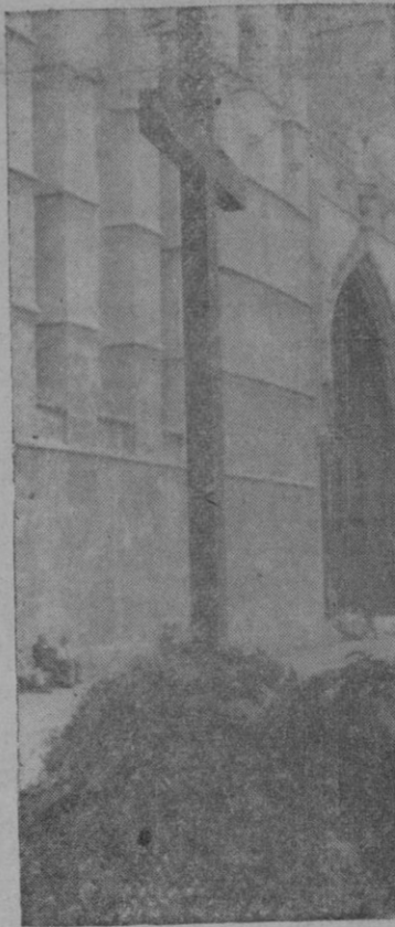
La Cruz de los Caídos, permanente recuerdo a los que murieron por Dios y por España

Por eso, y respondiendo a su idea de siempre, José Antonio dió el 24 de junio de 1936 aquellas terminantes consignas a las Jerarquías Territoriales y Provinciales del Movimiento, para advertirlas que considerasen hasta que punto sería efectivo para la Falange el que se la propusiera "tomar parte como comparsa en un movimiento que no va a conducir a la implantación del Estado Nacional Sindicalista", prohibiéndoles concertar "pactos locales con elementos militares y civiles", consignas que aclara pocos días después, el 29, ante la gravedad de los hechos que se suceden ininterrumpidamente en el suelo patrio, y, asegurado, sin duda, de que