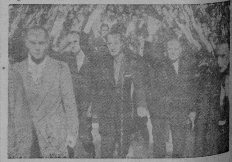
José Antonio en el entierro de uno de los caídos primeros de la Falange, en los meses que preceden al Alzamiento Nacional