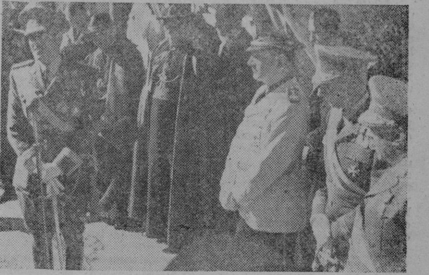
Con motivo de la fiesta de la Hispanidad se impuso la Medalla de Oro de Zaragoza a los Generales Monasterio y Urrutia, presidiendo las Autoridades y Jerarquías, entre ellas el Ministro del Ejército General Asensio y el Ministro Secretario General del Movimiento camarada Arrese.