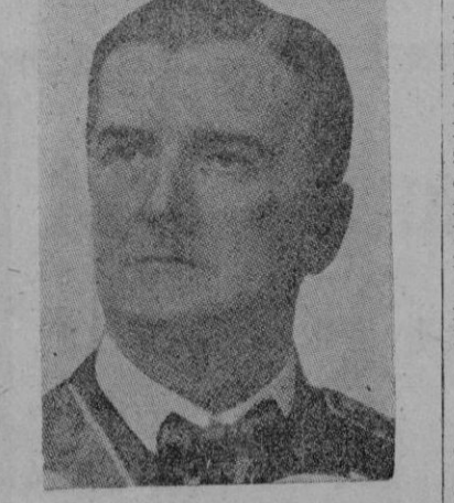
El Almirante Horthy

La retirada de Horthy y el nombramiento de Regente interino Londres. — La radio Budapest anuncia que el Regente Horthy se ha retirado y que el gobierno húngaro ha dimitido nombrándose Regente