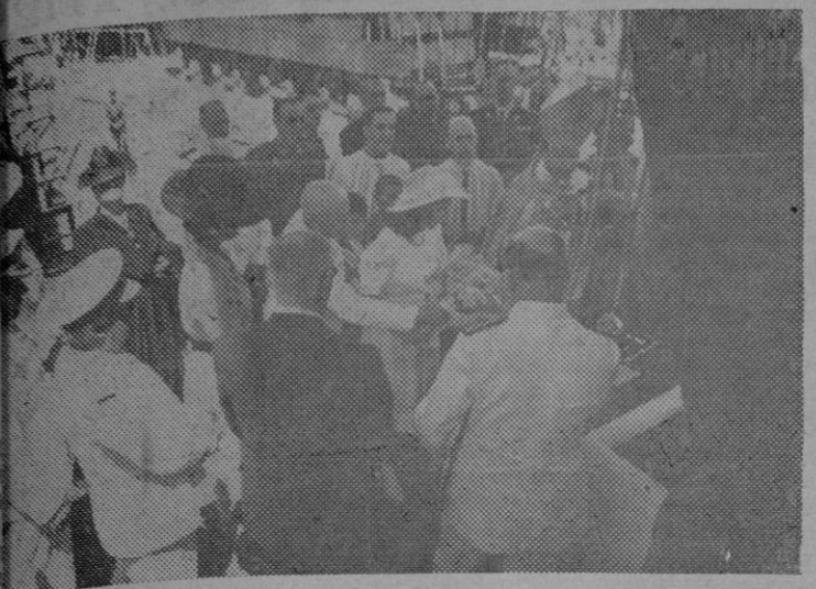
El Generalísimo, acompañado de su esposa, preside la emotiva escena de la bendición y bautismo de uno de los niños botados en el Ferrol del Caudillo.

LEA V. TODOS LOS DIAS CORREO DE MALLORCA