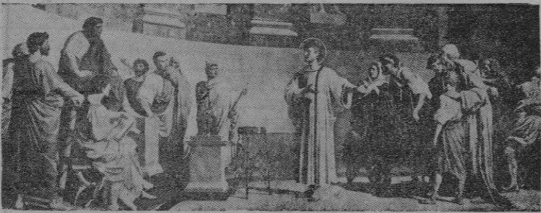
«He ahí nuestros tesoros» — Cuadro de Francassini