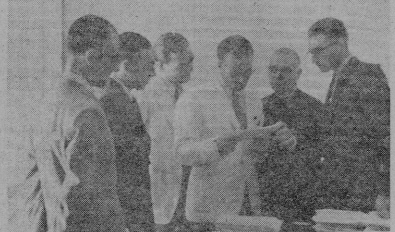
El Excmo. Sr. Gobernador Civil y Jefe Provincial del Movimiento visita la Delegación del Instituto Nacional de Previsión

Dedicamos ya hace algunos días un comentario general al decreto de Educación Nacional aprobado en el último Consejo de Ministros por el que se adoptan los reglamentos de régimen interno de las distintas Facultades Universitarias.