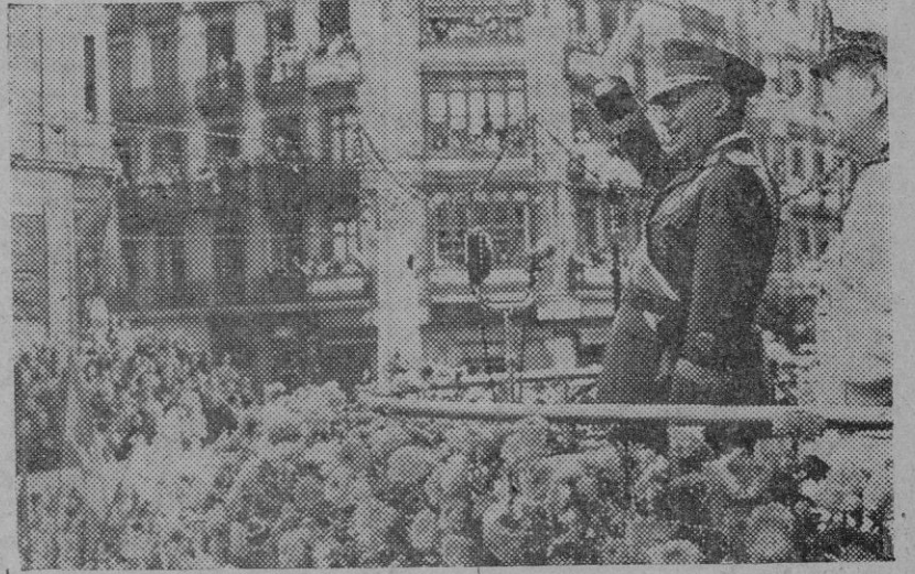
El Caudillo saluda brazo en alto al pueblo bilbaíno que le aclama lleno de indescriptible entusiasmo.