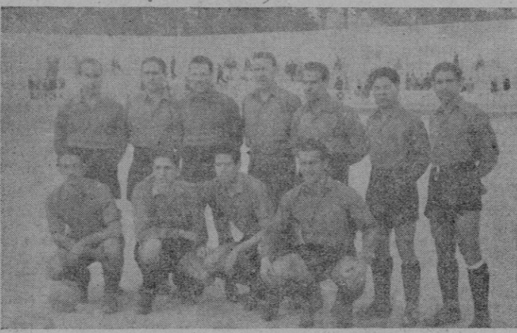
El equipo del "Mallorca", en el campo del "Elche"