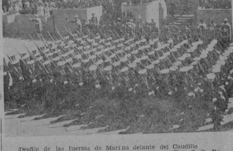
Desfile de las fuerzas de Marina delante del Caudillo