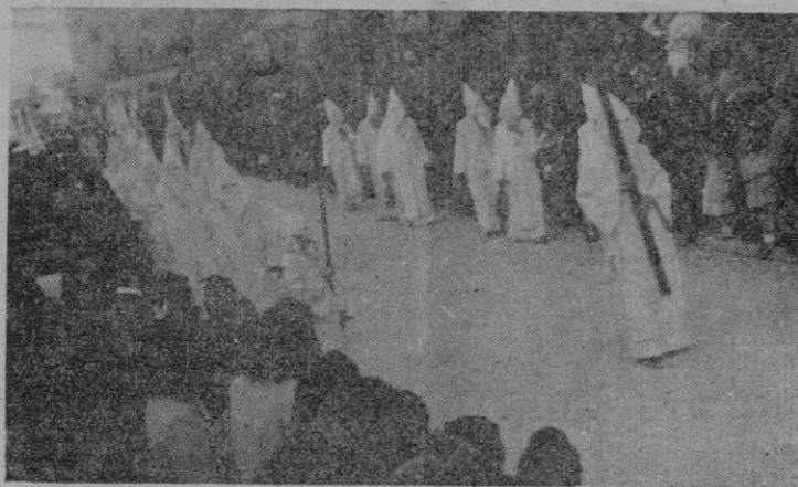
Un aspecto de la procesión del Jueves Santo