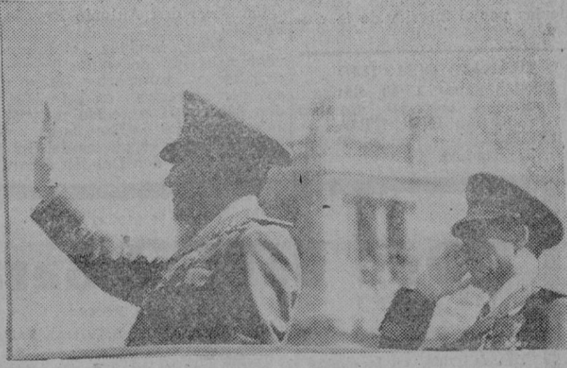
El Caudillo saluda al paso de las centurias del Frente de Juventudes.