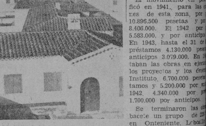
Barrio edificado por la Obra Sindical del Hogar para albergar a los trabajadores de los Astilleros de Cartagena.

El movimiento en pesetas de esta zona, por 10.896.500 pesetas y por 8.406.000.