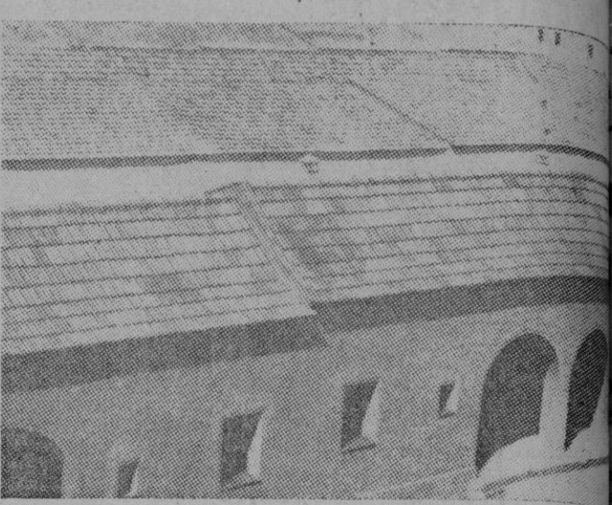
Tipo de vivienda para productores edificado por el Sindicato del Hogar en Alicante.

La política actual de la vivienda divide su misión en varios tipos atendiendo preferentemente a las