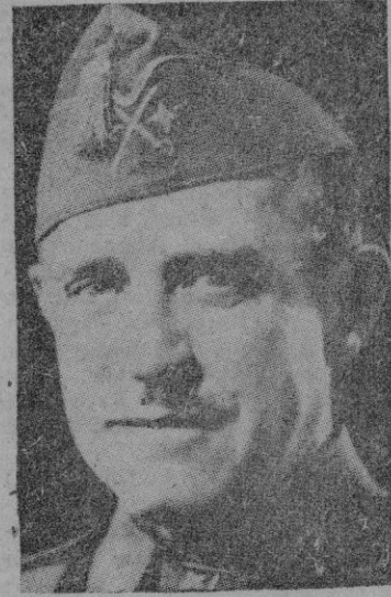
El Ministro de Asuntos Exteriores, Excmo. Sr. Conde de Jordana.

"Yo sé perfectamente que el derecho mucho el tono meridional y patriótico con que me ha sido planteada la cuestión tan delicada, más cuanto que por mí se ha hecho muchos años de prensa, se su espíritu de ingenio en la polémica."