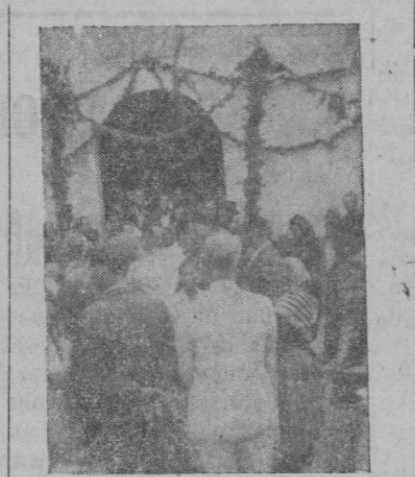
Los fieles al salir de la primera misa